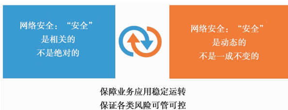
图 1 网络安全本质属性

的安全事件进行实时防御和响应处置,对潜在的安全威胁进行持续监测,以及对已发生安全事件的分析溯源(陶源等,2020),并通过信息通报平台上传、下达各类预警信息,确保各类异常事件及时、有效、有序处理,在满足合规运行的基础上,逐步实现能力提升和安全运营,进一步推动地震网络安全发展的现代化进程(图 2)。